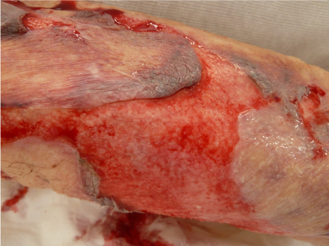
Guðbjörg Pálsdóttir, 2015