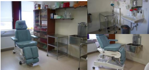
Opnuð sáramóttaka á dag- og göngudeild lyflækninga 20. febrúar 2008