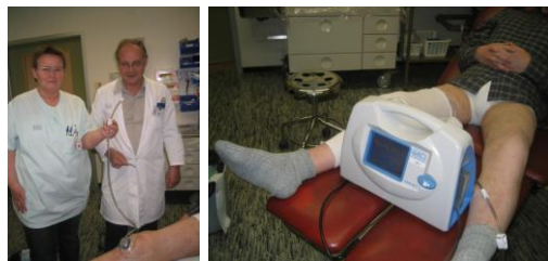
Sárasogsmeðferð hefst – vígslan, föstudaginn 13.apríl 2007